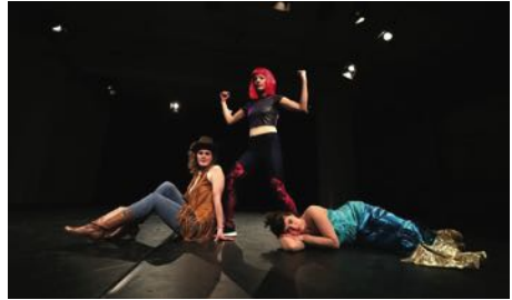
„Wann hast du das letzte Mal ...“