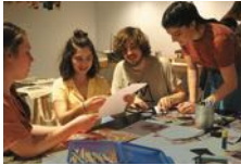
Labyrinth Kindermuseum/Grit Kümmele

ARTE-Sommerkino neu Kulturforum am Potsdamer Platz Matthäikirchplatz 4/6 10785 Berlin Spielzeit: 04.07.–02.09.2018 Informationen und Online- Tickets unter www.yorck.de Mitglieder der TheaterGemeinde zahlen täglich 6,50 € statt 8,50 €/7,50 €.