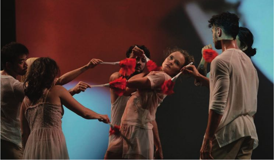
„die einen, die anderen“ in der HALLE TANZBÜHNE BERLIN, Foto: Dieter Hartwig