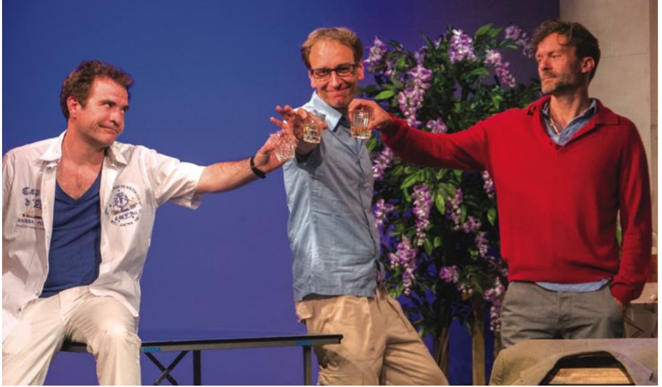
„Die Rechnung“ im Kleinen Theater