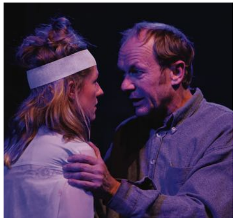
„Die Vögel“