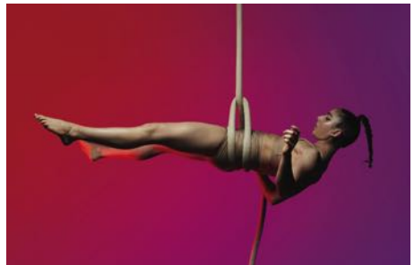
„CIRCA'S PEEPSHOW“