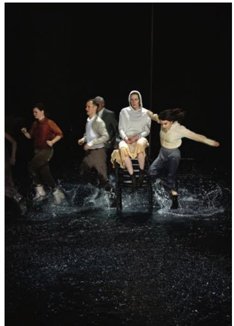
„Medea. Stimmen“

S PREISGRUPPE O (19,50) Gastkartenzuschlag 3,00