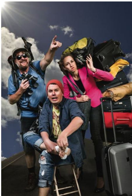
„Wenn Deutsche über Grenzen gehen“