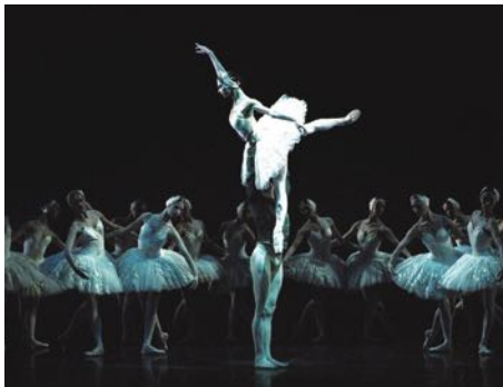
„Schwanensee“, Foto: Drama