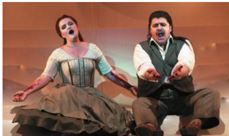
„Tristan und Isolde“