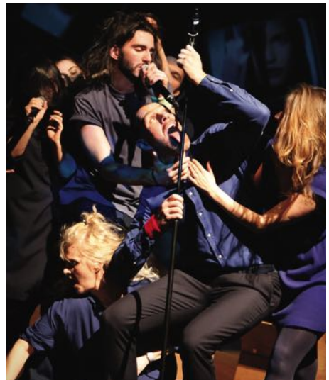
„Common Ground“, Foto: Drama

S PREISGRUPPE 0 (19,50) Gastkartenzuschlag 3,00