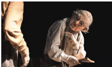
„Wenn wir tanzen, summt die Welt“, Foto: Steffen Baraniak