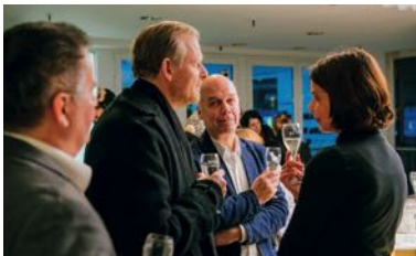
Adj 2016/17: Professor Bernhardi, Schaubühne

Die Auszeichnung „ Aufführung des Jahres “ ist ein echter Publikumspreis: Nur die Mitglieder der TG Berlin entscheiden die Wahl. Sollte sich Ihr persönlicher Favorit nicht unter den Nominierungen befinden (siehe vordere Umschlagseite innen), können Sie auch eine andere Inszenierung benennen.