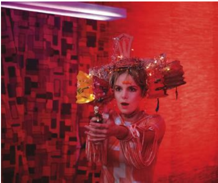
HAUEN•UND•STECHE, Foto: Thilo Moessner