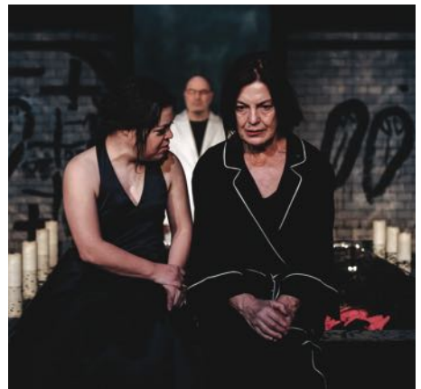
„Die Frauen vom Meer“, Foto: Andi Weiland