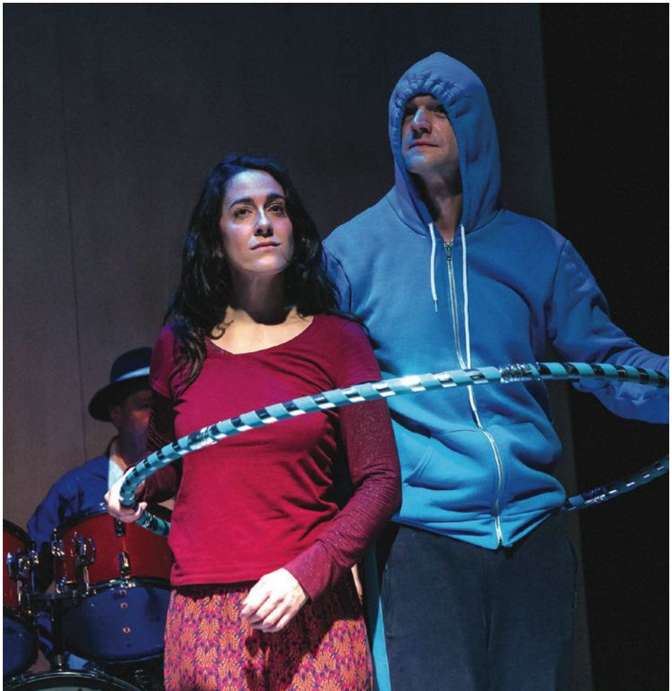
„Auf Weltreise mit den Millibillies“