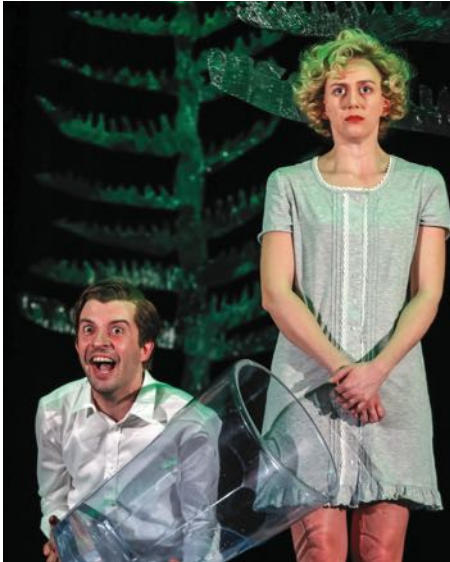
„Der Tag, als ich nicht ich mehr war“, Foto: Drama