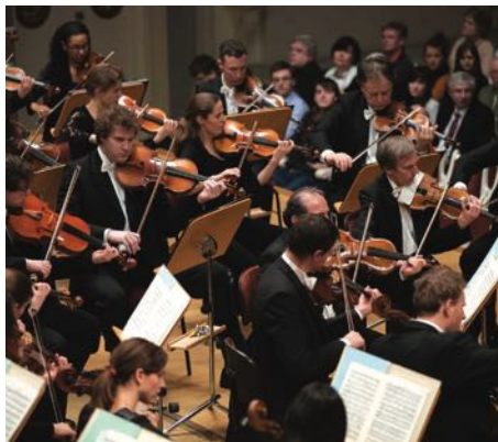
Das Konzerthausorchester