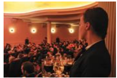
Astor Film Lounge/Premium Entertainment

Adria Filmtheater Schlossstraße 48, 12165 Berlin Telefon: 0180 55 07 11*** www.cineplex.de/adria 2,- € Ermäßigung auf Tickets für Kinofilme und Live-Übertragungen**