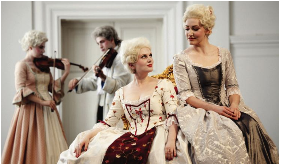
„Meisterwerke des Barock“