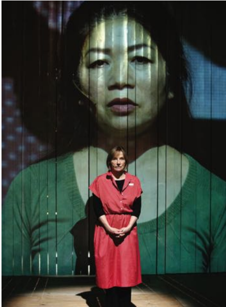
„Atlas des Kommunismus“, Foto: Drama