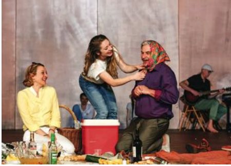
„Sommergäste“, Foto: Drama