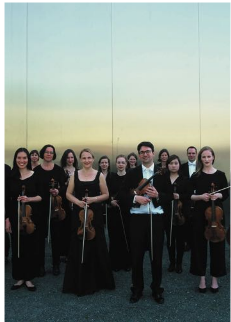
Deutsches Kammerorchester Berlin