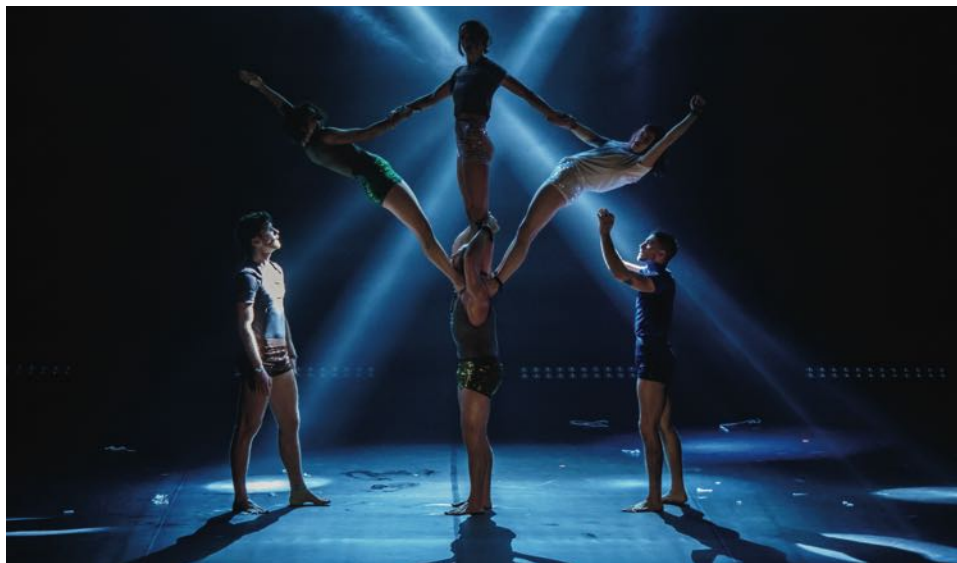
„CIRCA'S PEEPSHOW“ – die neue Show im Chamäleon Theater