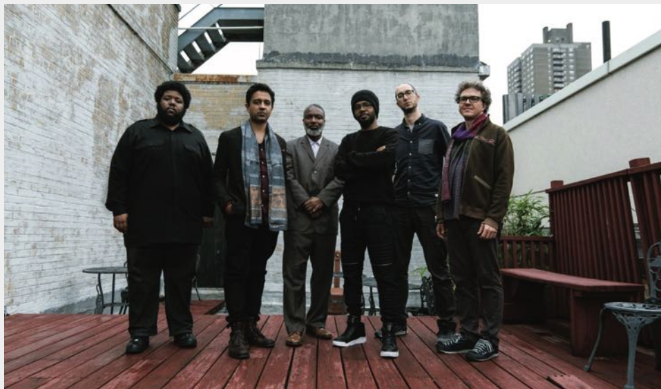
Vijay Iyer Sextet, Foto: Veranstalter