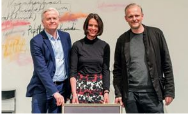
Adj 2016/17: Professor Bernhardi, Schaubühne