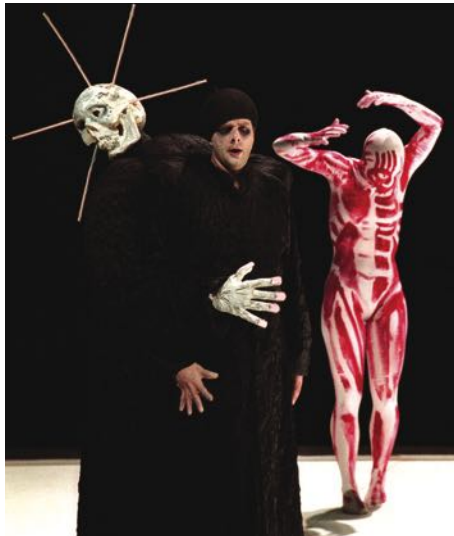
„Messa da Requiem“

In Episoden wird das Leben und Sterben eines Romantikers erzählt, der nicht als aktiv Handelnder auftritt, sondern in der Nachfolge eines Lord