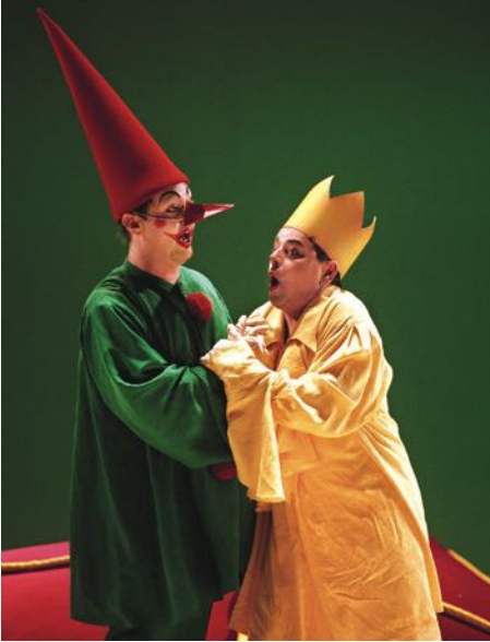
„Die Liebe zu drei Orangen“, Foto: Drama