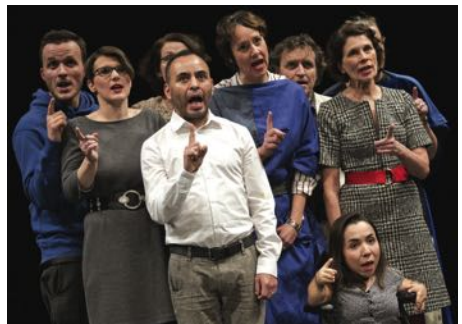
„Oratorium“, Foto: Benjamin Krieg