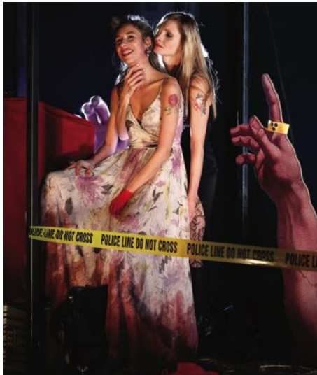
„Das Missverständnis“, Foto: Drama

S PREISGRUPPE 0 (19,50) Gastkartenzuschlag 3,00