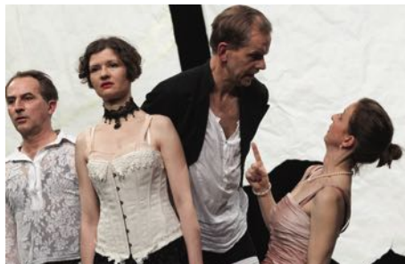
„Proust 3 / 267 - 435“