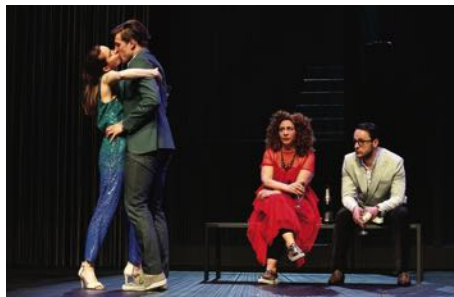
„A walk on the dark side“, Foto: Drama

S PREISGRUPPE 0 (19,50) Gastkartenzuschlag 3,00