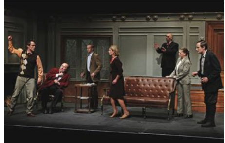
„Die Mausefalle“

S PREISGRUPPE 0 (19,50) Gastkartenzuschlag 3,00