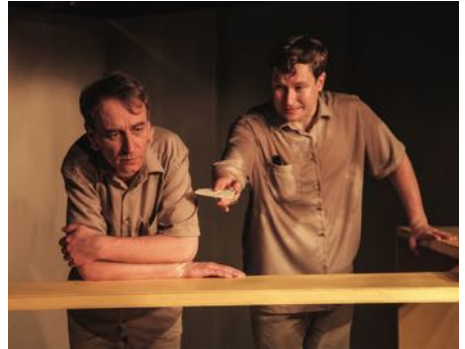
„Der Nazi & der Friseur“, Foto: Manuel Graubner