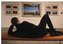
Museum THE KENNEDYS/Grit Kümmele