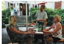
Café Villa Oppenheim/Grit Kümmele

Brennerei – das Landgasthaus Stiftung Schloss Neuhausenberg Schinkelplatz 15320 Neuhausenberg Telefon: 033476 60 00 www.schlossneuhausenberg.de Täglich 11–22 Uhr 20% Rabatt auf Speisen und Getränke