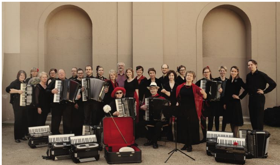
Das Akkordeonorchester Euphonia mit „¡Vive la Vida! Südamerika - Klassik - Tango“ am 9. Oktober im Konzerthaus